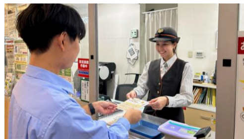
駅改札での商品受取イメージ