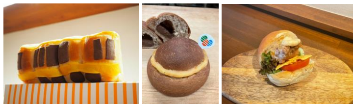
中央線が大好きパン