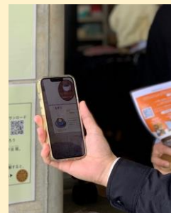
スマホを使った謎解きイベント （過去開催のイベントより）

関連企画『中央線「解」速 パンなぞ解きデジタルスタンプラリー』 「中央線パンまつり 2023」当日やイベント前後の期間で、スマホを利用した駅ビルや街なかのベーカリー巡りを楽しむ謎解きイベントを実施（開催期間：11月4日～12月27日）