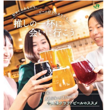
中央線ライフを楽しむWEBマガジン「中央線が好きだ。」7月は『中央線クラフトビールのススメ』特集！