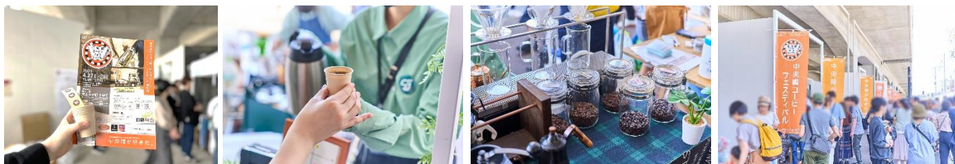
中央線コーヒーフェスティバル 2024Spring 開催時の様子