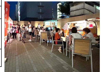
武蔵境会場のイメージ (過去の他イベント開催時より)