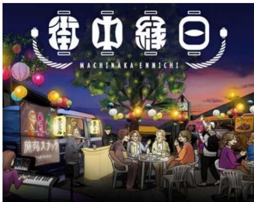
街中縁日のイメージ