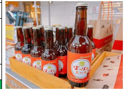
旅するスナックでご提供する 「ぽっぽやエール」