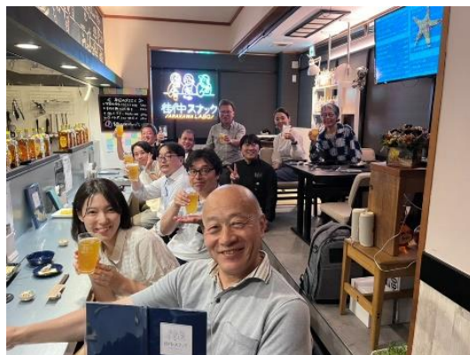
街中スナック店内の様子