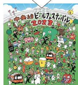
ビジュアルも年々よりにぎやかに！