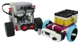
① ロボットの組み立て