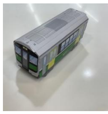
【ペーパークラフト完成イメージ】