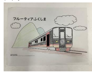
【フルーティアふくしまぬりえ】