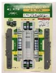
【只見線キハ E120 形ペーパークラフト】