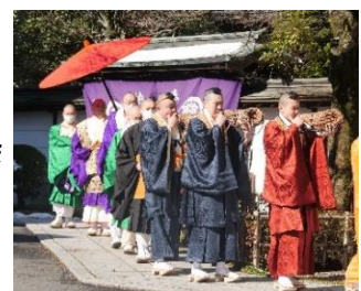
薬王院お練りの様子（イメージ）