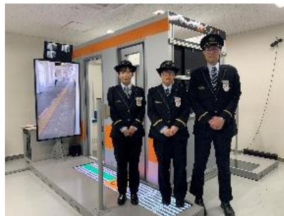
三鷹駅・豊田運輸区

私たちも、車内放送や駅の告知ブースなどで盛り上げます！ぜひ美味しいコーヒーを飲みにお越しください！