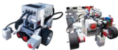
① ロボットの組み立て

主な使用教材である教育版レゴ® マインドストーム® EV3 等を用いて、モーターや各種センサーを使ってロボットを組み立て、ビジュアルアイコンを使ったソフトウェアでプログラミングを行います。