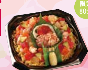
海鮮ひなちらし・花にしき 1,079円

「海鮮ひなちらし・花にしき」は まぐろ、いくら、えびなど海鮮の味わい豊かな ちらし寿司です。