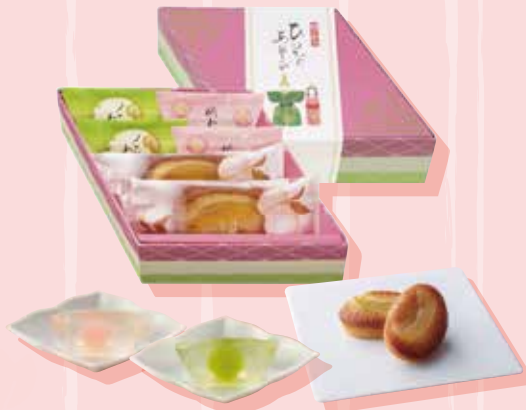
ひいなあそび / 1,512円

香り良いメロンと瑞々しい白桃のゼリーをそれぞれ とじ込めた「フルーツわらび餅」と白桃の果肉を あしらった「白桃フィナンシェ」の詰合せです。