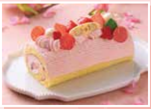
ひなまつりロール / 2,862円

いちご風味のクリームにフレッシュな いちごを巻いて華やかに飾り付けをしました。 ご家族みんなで楽しめる、ひなまつりに ぴったりなかわいらしいロールケーキです。