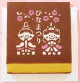
ひなまつりカステラ(S号) / 1,080円