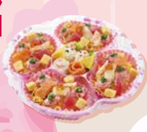
お雛様海鮮ちらし / 1,580円