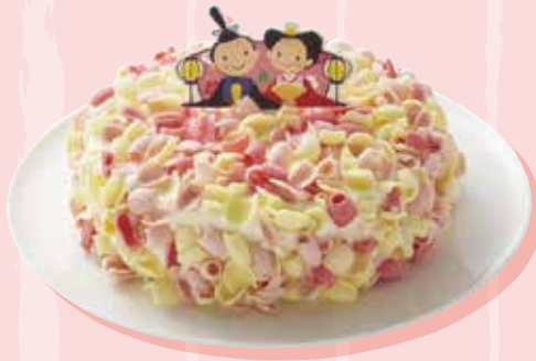
ひなまつり 春てまり / 1,944円

たまごの風味豊かなスポンジに、甘酸っぱい ストロベリークリームをサンドし、クリーム シャンティと白、ピンク、赤色のコボチョコレートで 華やかに包み込みました。 春らしい爽やかな味わいです。