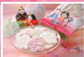
ひなまつり花三色 / 422円

梅型に生地を焼き上げ、糖蜜をかけた 甘じょっぱい味付けのクセになるおせんべいです。 むらさき芋とよもぎで色付けしました。