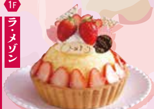
紅ほっぺとクレープの マスカルポーネクリームタルト / 4,480円

カスタードタルトにいちごジュレをしのばせ、 なめらかなマスカルポーネクリームを重ね ました。クレープにディプロマットクリームを のせ、甘酸っぱい紅ほっぺをかざった 春のお祝いにぴったりのタルトです。