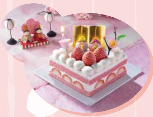
ひなまつり 苺のデコレーションケーキ (大・3~4名用) / 3,769円