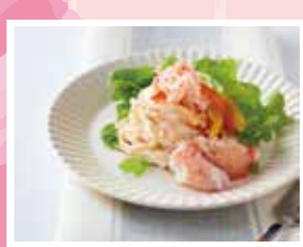
蟹づくしのパスタサラダ (100g) / 734円

紅ずわいかに、まるずわいがにの美味しさを 堪能するパスタサラダです。コクのある マヨネーズソースにマスタードでアクセントを 加えた、クセになる味わい。 大人から子供まで楽しめる美味しさです。