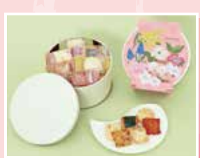
kumitte(クミット) (21個入) / 1,296円