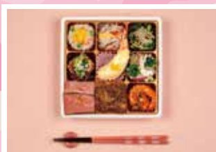
春のオールスター弁当 / 1,620円