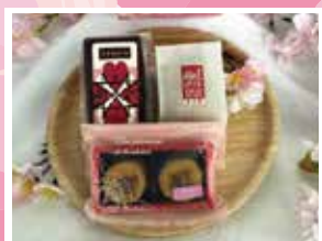
春らんまん / 1,285円

定番高尾ポテトのあずきとお子様にも人気の チョコマンマに、季節限定のさくらポテトを 詰め合わせました。ひな祭りにもおすすめです。