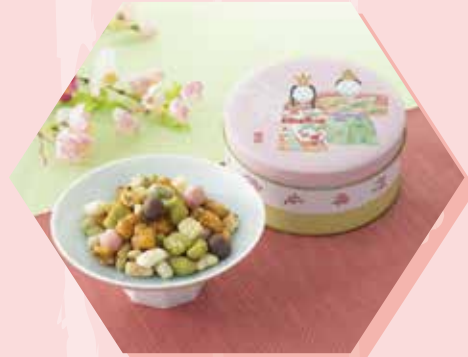
ひなあられ / 1,296円