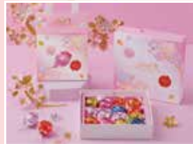
リンドール ジャパンコレクション (6個入) / 1,500円・(14個入) / 2,980円