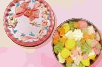
【ラトリエサクラ】 メレンゲアソート缶 / 1,512円

福生市の菓子店、「ラトリエサクラ」のメレンゲ クッキー。味も形もそれぞれ異なる6種類のメレ ンゲクッキーと、色鮮やかな金平糖を組み合わせ ました。見た目も味も楽しめる、ひなまつりに ぴったりな可愛いおいしいアソート缶です！