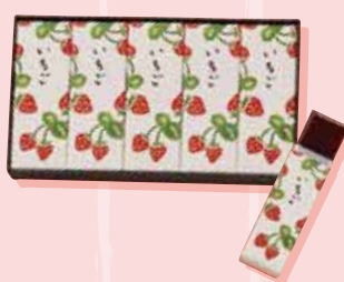
小形羊羹『いちご』(5本入) / 1,890円

こし餡にいちごを合わせた、季節限定の羊羹です。 いちごの甘酸っぱい風味と、餡との調和を お楽しみください。