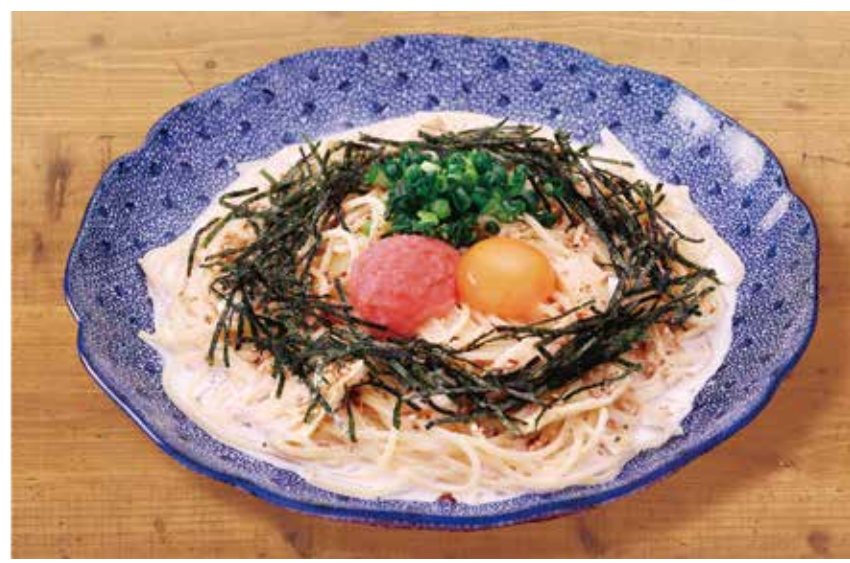
〔スパゲッティ〕洋麺屋 五右衛門 たらこ湯葉と モッツアレラチーズの カルボナーラ 1,200円