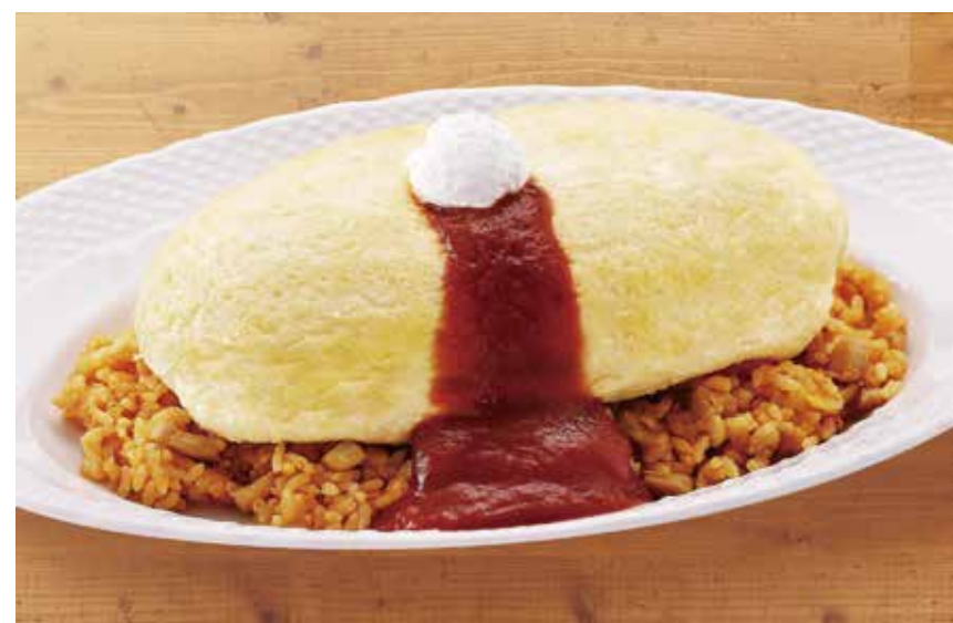
〔オムライスの店〕卵と私 スフレ卵のオムライス 1,100円