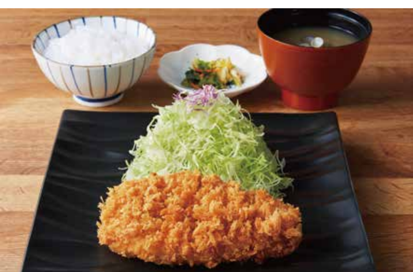
〔とんかつ〕とんかつ和幸 和幸御飯 1,050円 ・ロースかつ・ご飯・味噌汁・お新香 - ご飯・味噌汁・キャベツおかわり自由 - 平日（11:00～16:00）限定