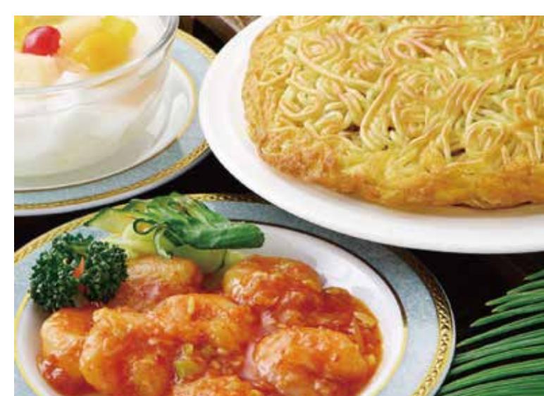
〔中華料理〕梅蘭 週替りランチセット 1,400円 ・梅蘭焼きそば（小）・本日の一品料理 ・杏仁豆腐 （+100円 焼きそば大盛り、+200円 辛口焼きそば、 +300円 海鮮焼きそばに変更できます。） ※写真は一例です。 平日（11:00～15:00）限定