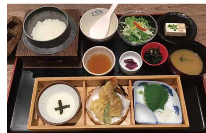
〔和食 定食〕 おばんざい処 はんなり おばんざい御膳 1,672円 ・天ぷら4種・いかそうめん・とろろ・小鉢・サラダ・しば漬け ・冷奴・味噌汁・釜炊きごはん（白米又は十五穀米）