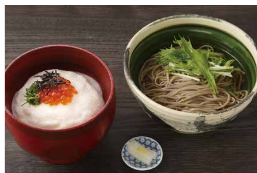
〔和食〕ご飯ととろろ とろ麦 そばと選べるとろろご飯 1,320円 ・かけそば or せいろそば・選べるとろろご飯 （あおさ海苔・紀州南高梅・遠州産産釜揚げしらす・信州安曇野まるまるわさび なめ茸・ちりめん山椒・温玉・納豆・辛子明太子・北海道産秋鮭いくら） 平日（11:00～15:00）限定