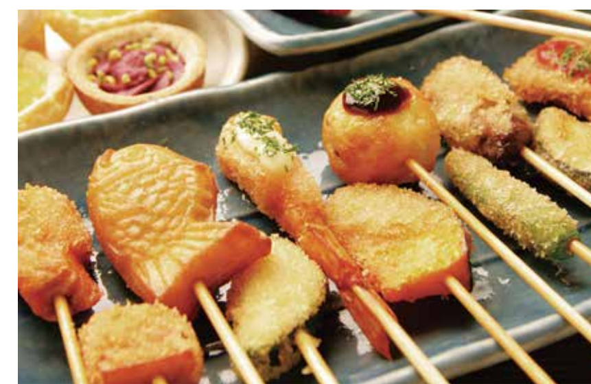
〔串揚げビュッフェ〕串家物語 ビュッフェ食べ放題 2,000円 ・串揚げ・惣菜 （+330円でドリンクバーをご利用いただけます。） 平日限定