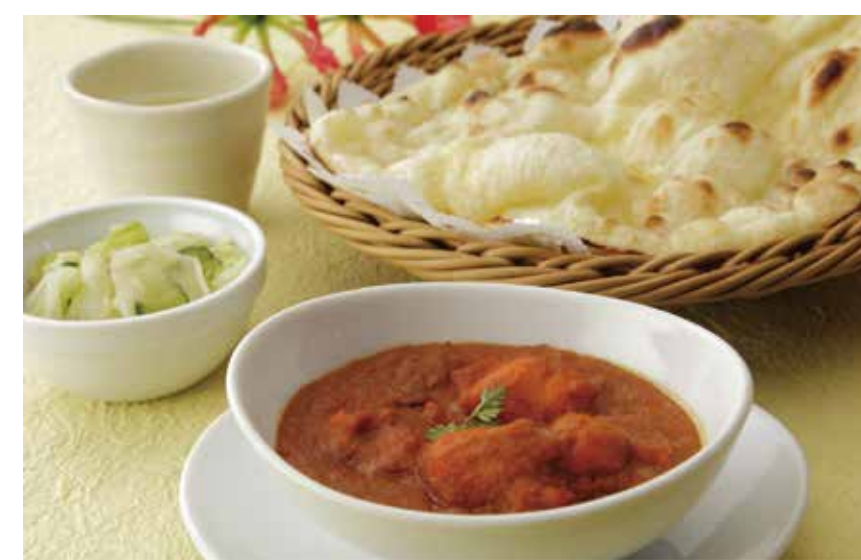
〔インド料理〕ローカルインディア カレーランチ 1,080円 ・本日のカレー3種類からおひとつ ・ナンまたはライス・サラダ・スープ 全日（11:00～17:00）限定