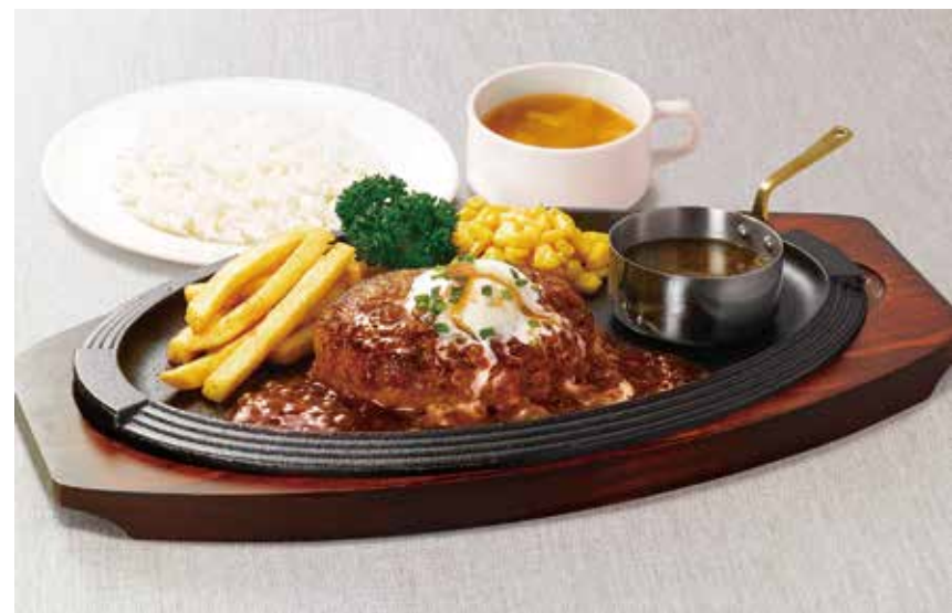
〔レストラン〕 ロイヤルホスト 黒×黒ハンバーグランチ 1,628円 ・黒×黒ハンバーグ・ライス・スープ （+330円でドリンクバーをご利用いただけます。） 平日（11:00～15:00）限定