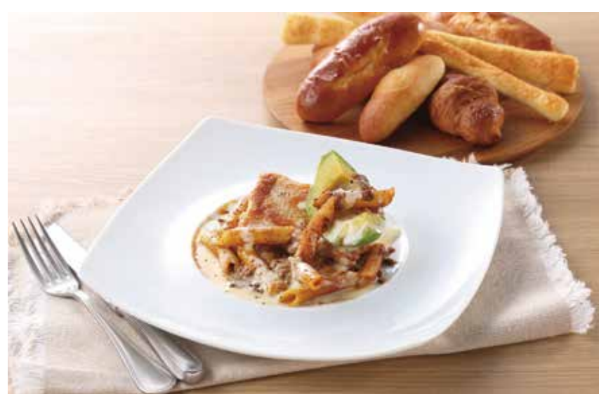
〔ベーカリーレストラン〕サンマルク 若鶏のロティ ラザニア風チーズソース 1,749円 （焼きたてパン食べ放題付き） 平日（11:00～16:00）限定