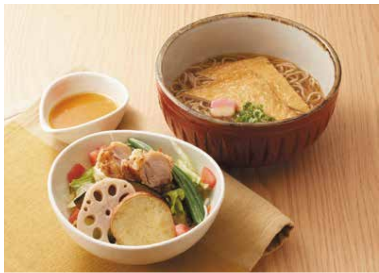
〔和食処〕三宝庵 そばと野菜の温もりセット 1,120円