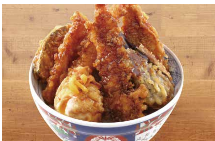
〔天麩羅〕天麩羅えびのや 天井 1,200円 ・天井・味噌汁・香物・明太子食べ放題 -