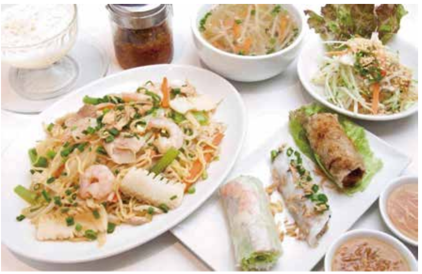
〔ベトナム料理〕ジャスミンパレス ベトナム五目焼きそばセット 1,650円 ・五目焼きそば・生春巻き・揚げ春巻き・蒸し春巻 ・サラダ・デザート