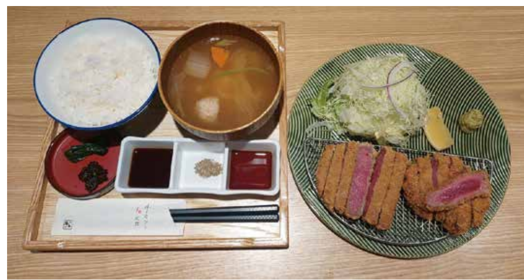
〔牛カツ・定食〕 牛カツと和定食 京都勝牛 牛サーロインカツと 牛ロースカツ膳 2,079円 ・牛サーロインカツ・牛ロースカツ ・ごはん・汁物・漬物