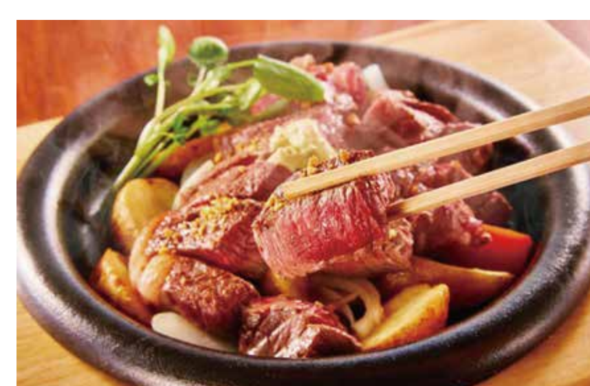
〔ステーキ〕 宮崎ステーキハウス 霧峰 厳選赤身ステーキランチ 100g 1,859円 （ステーキ・ライス（おかわり無料）・スープ付き） 平日（11:00～17:00）限定