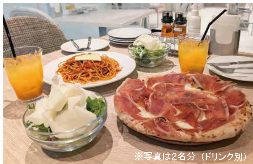
〔イタリアンレストラン〕 ピッツェリア・ドオーロ ナポリ ランチセット 1,518円～ ・ピザ or パスタ・サラダ ※写真とは2名分（ドリンク別） 平日（11:00～16:00）限定