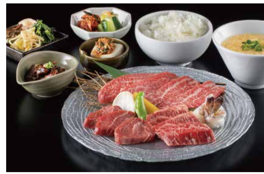
〔焼肉〕焼肉トラジ トラジ御膳 4,290円 / Sサイズ 3,410円 〔焼物〕黒毛和牛カルビ、芯ハラミ、赤身ロース、海老 〔前菜〕小鉢2種、キムチ、ナムル 〔ご飯物〕ライス、スープ 全日（11:00～14:30）限定