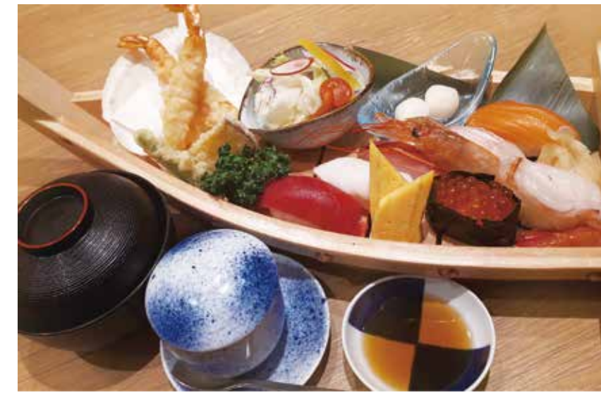
〔海鮮居酒屋〕築地魚力 船盛御膳 1,958円 ・本日のおまかせにぎり7貫・天ぷら・茶碗蒸し ・味噌汁・甘味・選べる小鉢（サラダまたは根菜） 全日（11:00～15:00）限定