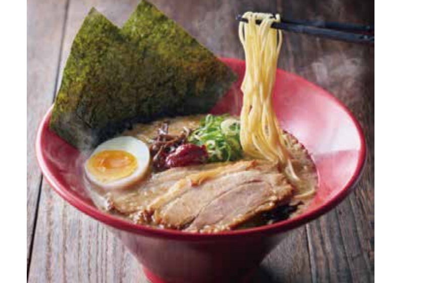
〔ラーメン〕一風堂 赤丸新味 [ギョーザ・ごはんセット] 1,190円 平日（11:00～15:00）限定