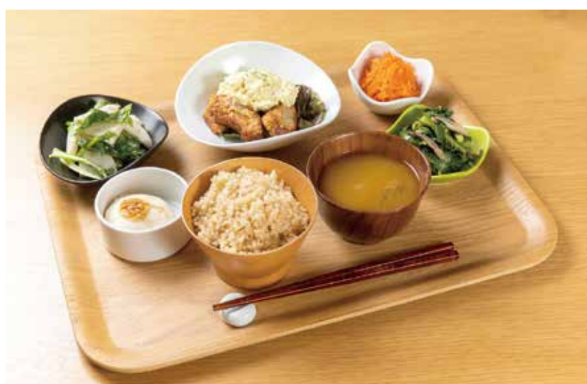
〔オーガニックダイニング〕 きせきの食卓 車麩のフライ 豆腐タルタルのせ 1,485円 ・副菜3品・人参ラベ ・玄米ご飯・北海道大地の味噌汁 ※ディナータイムはセット内容と価格が異なります。 全日（11:00～16:00）限定