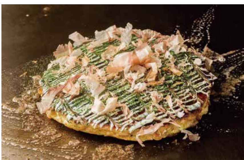
〔お好み焼 鉄板焼〕千房 お好み焼ランチ 1,300円 ・豚玉・サラダ・ドリンク （+250円でビール・ハイボールに変更いただけます。） 平日限定