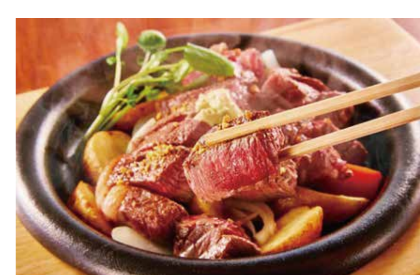
〔ステーキ〕 宮崎ステーキハウス 霧峰 厳選赤身ステーキランチ 100g 1,859円 (ステーキ・ライス(おかわり無料)・スープ付き) 平日(11:00～17:00)限定