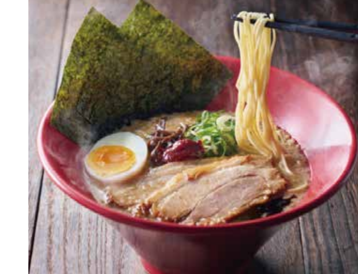
〔ラーメン〕一風堂 赤丸新味[ギョーザ・ごはんセット] 1,190円 平日(11:00～15:00)限定