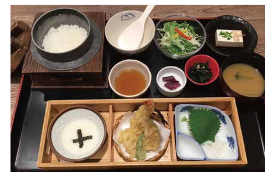
〔和食 定食〕 おばんざい処 はんなり おばんざい御膳 1,672円 ・天ぷら4種・いかそうめん・とろろ・小鉢・サラダ・しば漬け ・冷奴・味噌汁・釜炊きごはん(白米又は十五穀米)