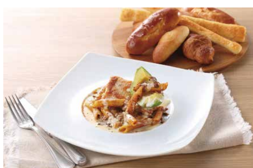
〔ペーカリーレストラン〕サンマルク 若鶏のロティ ラザニア風チーズソース 1,749円 (焼きたてパン食べ放題付き) 平日(11:00～16:00)限定