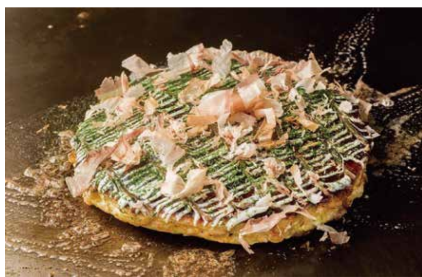
〔お好み焼 鉄板焼〕千房 お好み焼ランチ 1,300円 ・豚玉・サラダ・ドリンク (+250円でビール・ハイボールに変更いただけます。) 平日限定