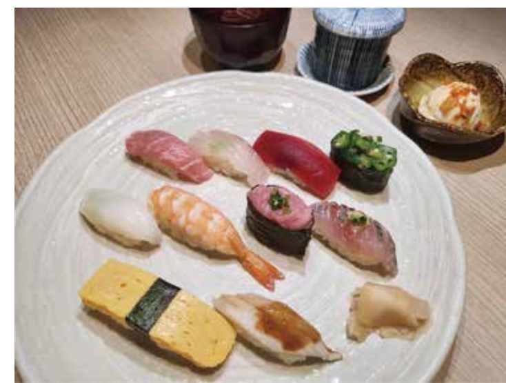
〔寿司〕寿司田 写楽(しゃらく) 1,430円 ・ミニサラダ・茶碗むし・お椀付き