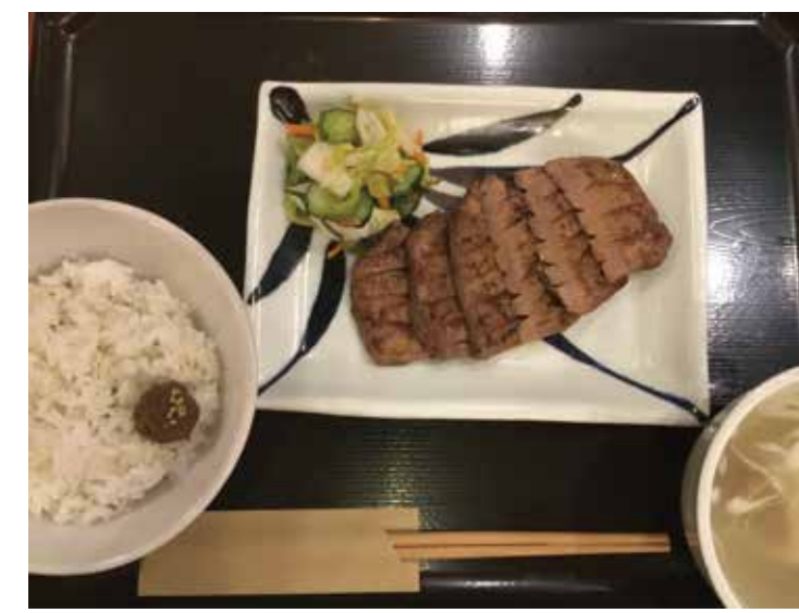
〔牛たん焼き専門店〕 牛たん焼き 仙台辺見 極上厚切りたん焼き 2,180円 ・麦飯・浅漬け・テールスープ付 全日(11:00～15:00)限定