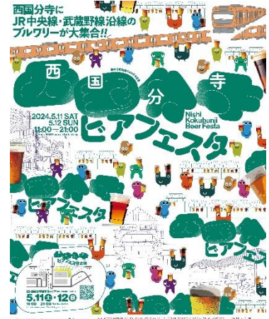
メインビジュアル デザイン：木村覚(Satoru Kimura)

◎特設サイト： https://chuosuki.jp/event2/nishikoku_beerfesta/