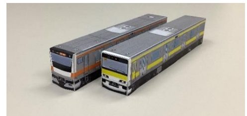
【ペーパークラフト（一例）】