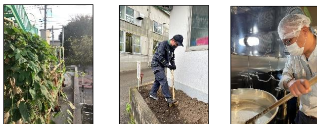
【ホップ栽培（三鷹車両センター）／ぽっぽやエール醸造の様子】

※今回販売する「ぽっぽやエール」は JR 武蔵境駅で栽培したホップを使用しています。