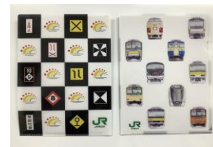
【オリジナルクリアファイル】

3か所いずれかの販売場所で、一度に2本購入ごとに「オリジナルクリアファイル」をプレゼントします。ビールの購入本数に制限はありませんが、クリアファイルには数に限りがあります。