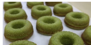
AnnBee こくベジドーナツ