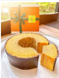
レ・アントルメ パンプキンバウム