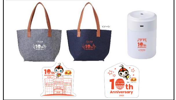
【10周年オリジナルグッズ】