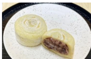
匠紀の国屋 あわ大福