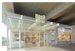
nonowa東小金井 (ヒガコマルシェ)