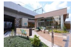
nonowa武蔵小金井 ムサコガーデン