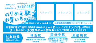
スタンプラリー用紙イメージ