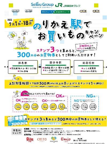
ポスターイメージ