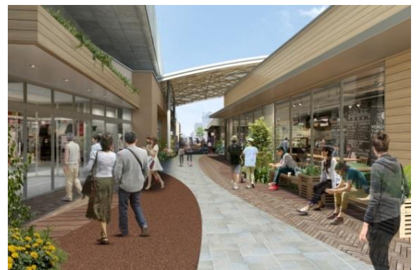
回遊歩行空間「ののみち」(イメージ)

また、ののみち沿いにはベンチも整備し、ムサコガーデン内でゆっくりとお過ごしいただくことができます。