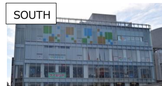
SOUTH 2016年12月1日運営変更 9店舗