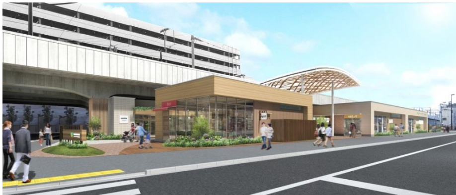
北側外観（イメージ）

【建物構造】 鉄骨造地上1階3棟 【敷地面積】 約3,640㎡ 【店舗面積】 約1,400㎡ 【店舗数】 4店舗 【駐車場/駐輪場】 7台/70台