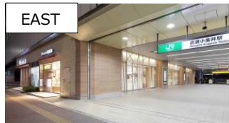
EAST 2015年2月19日開業 16店舗