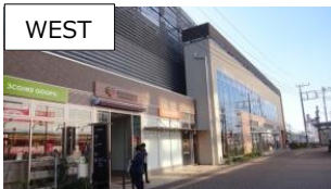
WEST 2015年12月12日開業 9店舗