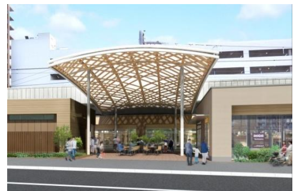
イベントスペースと大屋根(イメージ)

また「大屋根」には、東京の木「多摩産材」を使用しています。本施設は、東京都の「にぎわい施設で目立つ多摩産材推進事業」補助金を活用した施設です。大屋根の他に高架橋の柱巻きやベンチなど、随所に多摩産材を使用しており、東京都の森林や林業についても映像などで発信してまいります。