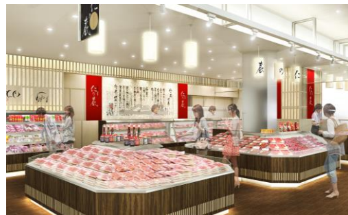
仁の蔵 イメージパース