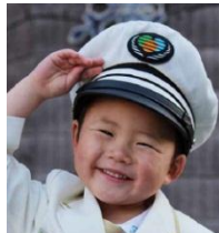
<子供駅長制服記念撮影>