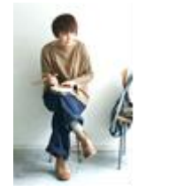
<Quinka,with a Yawn>