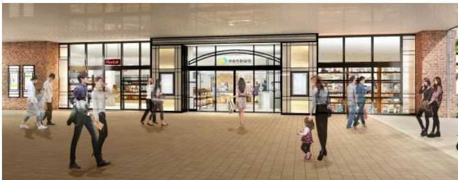
【正面エントランス】 黒を基調とした落ち着いたファザード

駅は街のエントランス、nonowa 国立は、街とともにいろいろなヒト・モノ・コトの集まる街のリビングのような存在へ。訪れるお客さまに洗練された上質なライフスタイルを提案します。