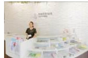
コンシェルジュ (イメージ)

よりわかりやすく駅やショッピングセンターをご利用いただけるサービス提供を旨とするともに、館内にデジタルサイネージを3箇所設置し、地域の情報、ショッピングセンターの情報を発信していきます。