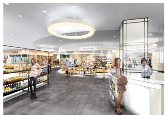
【館内】 シックな色合の床や天井で洗練された雰囲気を演出