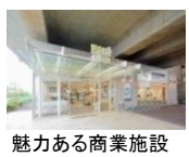
魅力ある商業施設

回遊歩行空間「ののみち」とは高架下を東西につなぐ幅2mの遊歩道。武蔵野の大地をイメージしたアースカラーの舗装と植栽で構成。南北道路との交差点「辻」には、ゆとりの広場「コミュニティガーデン」や「コミュニティテラス」を設置。夜間は辻行燈が高架橋を照らすなど、光の演出も行います。