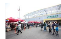
地域活性化イベント