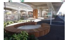
「コミュニティガーデン・テラス」