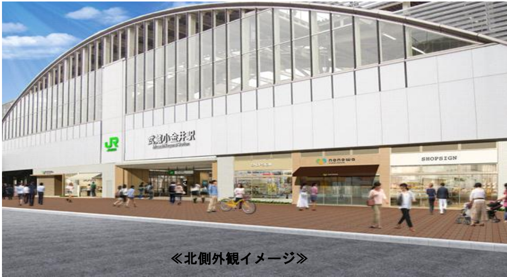
《北側外観イメージ》