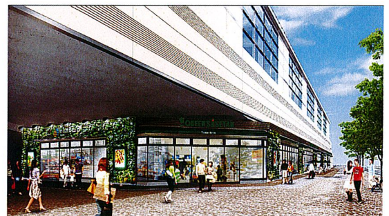
nonowa 武蔵境外観イメージ