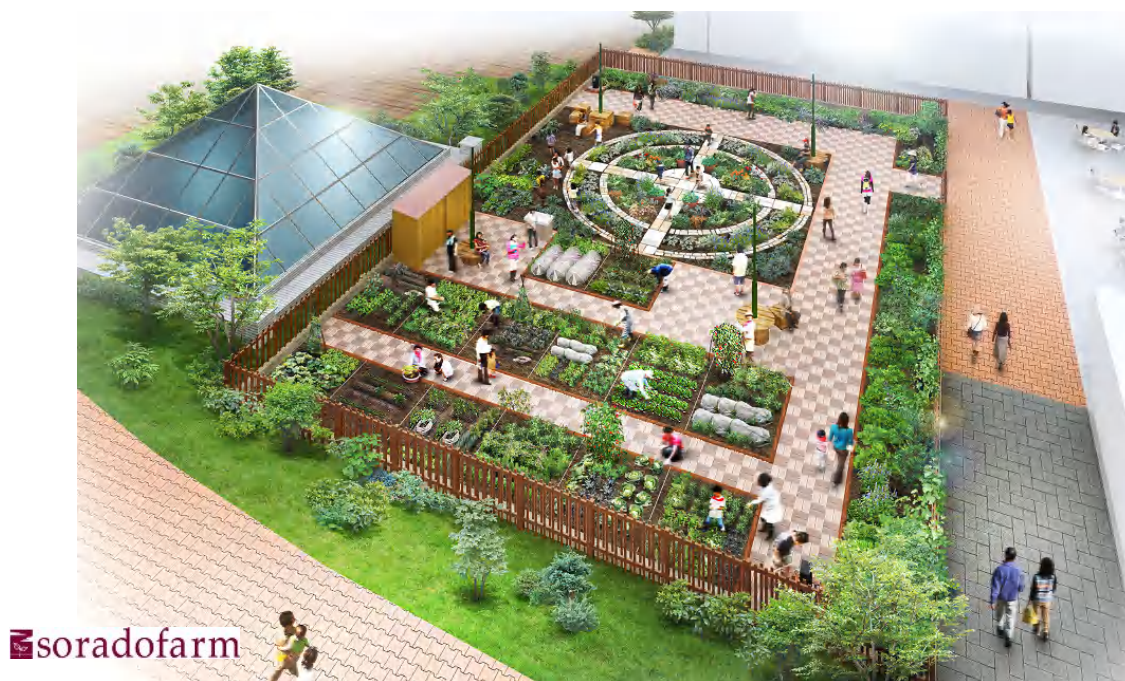
soradofarm セレオ八王子 イメージ