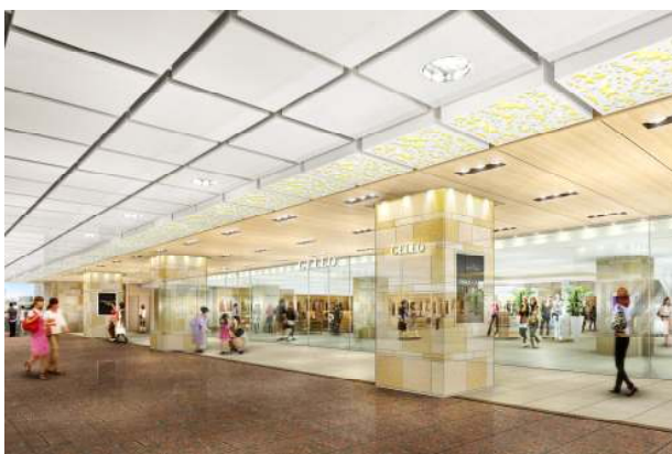
2F コンコースから見たエントランス

オープンに伴い、セレオ八王子で利用ができるセレオポイントカード事前入会キャンペーンを実施いたします。10月5日～10月24日の間に特設カウンターで、セレオポイントカードにご入会いただいた方に、100ポイントをプレゼントいたします。