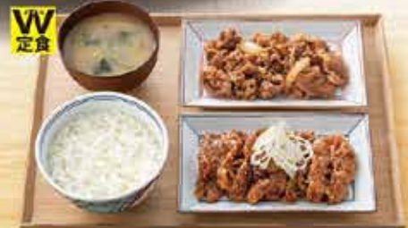
牛皿・牛カルビ定食