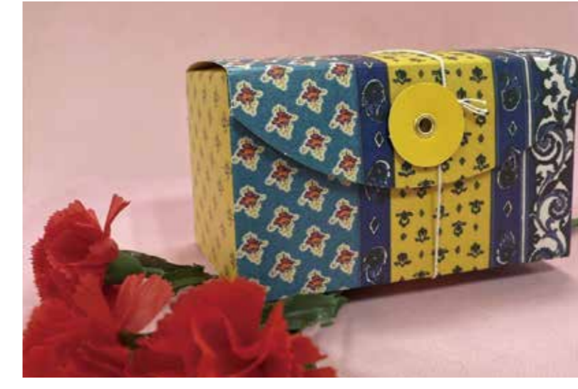
はちまるステーション [2F]

お母さんありがとうのメッセージ入りのカステラです。 販売期間 4/29(月祝)～