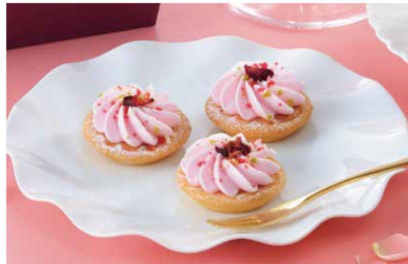
宗家 源 吉兆庵 [1F]

ブラッドオレンジのkokのある甘みと酸味、爽やかな香りが楽しめるセットです。 ※パッケージ、価格が変更となる場合がございます。