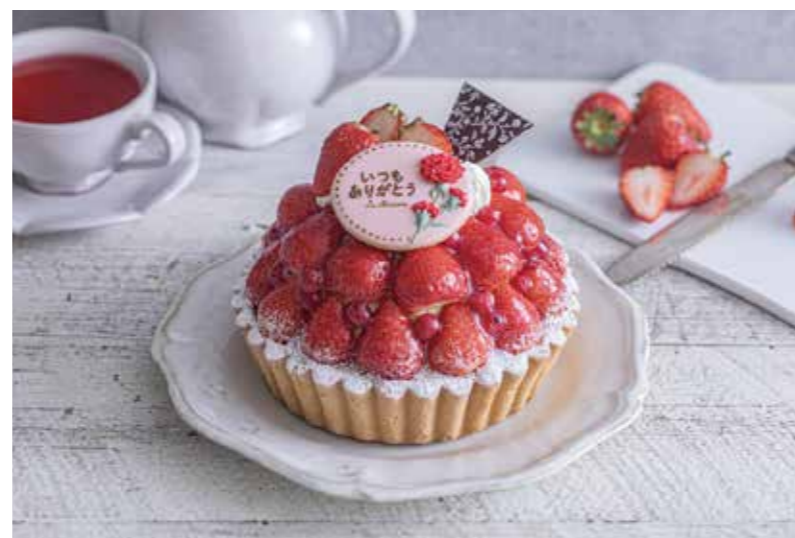
ラ・メゾン アンソレイユ タートルパティスリー [1F]

チョコレートスポンジで、チョコレートクリームとウォールナッツを組み、クリームシャンディでナッパしたケーキを、白、ピンク、赤色の3色のチョコレートで包みました。 販売期間 5/10(金)～12(日)