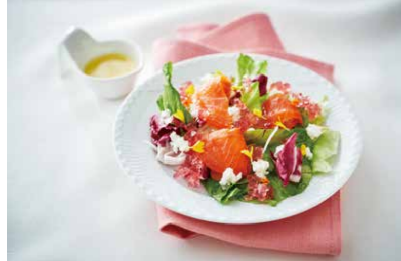
アール・エフ・ワン [1F]

人気のサンドイッチ。エビカツ、タマゴ、ストロベリー生クリームを1パックにしたトリプルサンドです! 販売期間 5/12(日)のみ