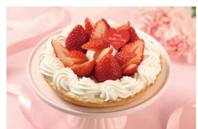
パステルデザート [1F]

カーネーションのブーケをイメージした母の日限定のスペシャルケーキです。ピンク色のシャンディクリーム・スポンジ・苺をサンドし、クレムディプロマドを重ね、ストロベリークリーム・苺・ブルーベリーで彩り鮮やかに仕上げました。 販売期間 5/10(金)～12(日)