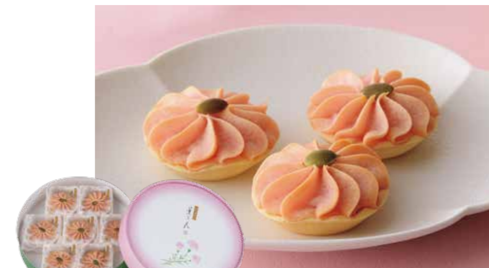
菓匠 清閑院 [1F]

母の日にふさわしい、華やかなカーネーション柄の羊羹、水羊羹をご用意いたしました。 販売期間 5/12(日) まで