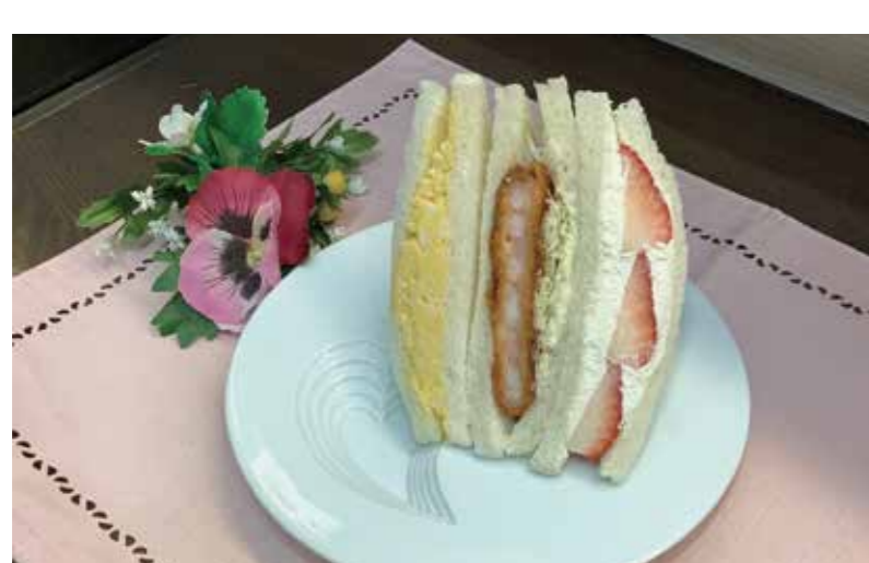
サンドイッチハウス メルヘン [1F]