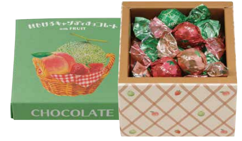
メリーチョコレート [1F]

“ありがとう”の気持ちを伝えるギフトセット。限定チョコレートなどとゴディバオリジナル柄のステンレスボトルをピンクのラッピング袋にセットしました。 販売期間 5/21(火) まで