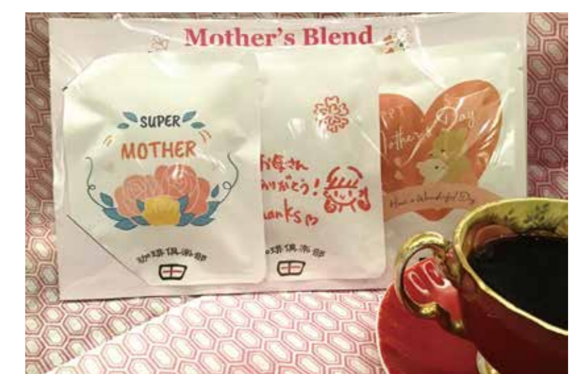
珈琲倶楽部 田 [B1F]