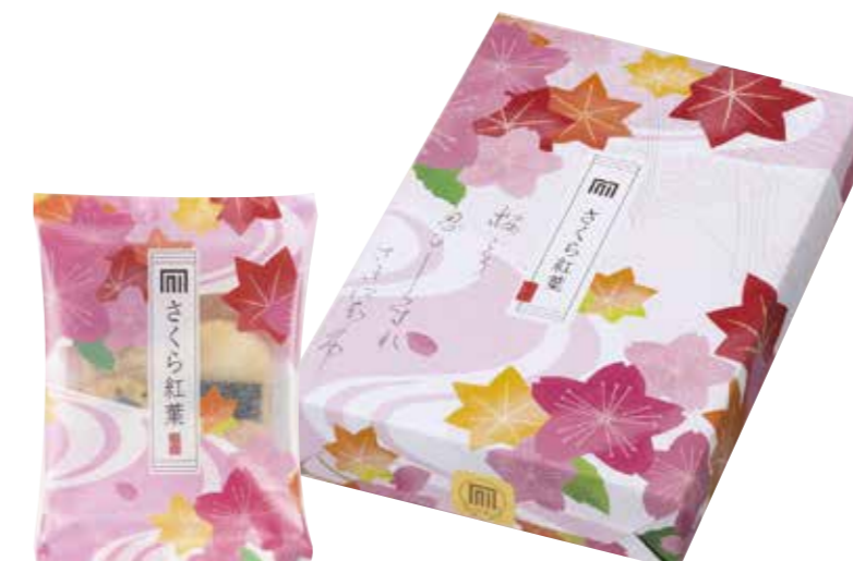
京都 宇治式部郷 [1F]

素材と素材を組み合わせたおまかせ詰合せ。カーネーションや野ばらなど、色鮮やかな花をモチーフにしたデザインを施しました。