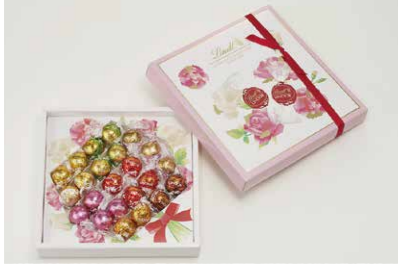
リンツショコラ ブティック [1F]