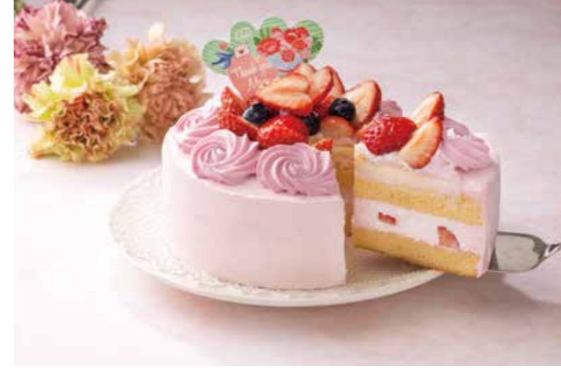
フロプレスージュ [1F]

なめらかなカスタードタルトにベルガモット香るアールグレイクリームといちごのクリームを重ねました。甘酸っぱいいちごアイシングクッキーを飾った母の日限定のタルトです 販売期間 5/3(金祝)～12(日)