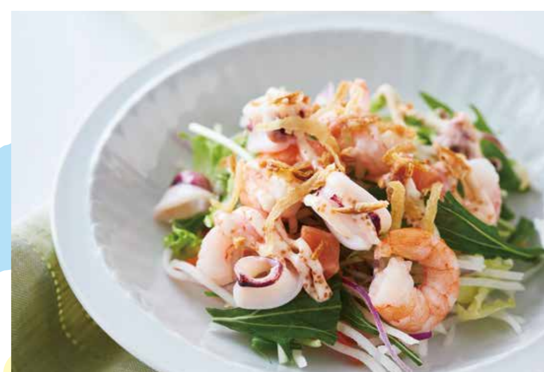
アール・エフ・ワン [1F]

年に一度の新茶、この時期だけのフレッシュな味わいです。 ※新茶袋はイメージです。