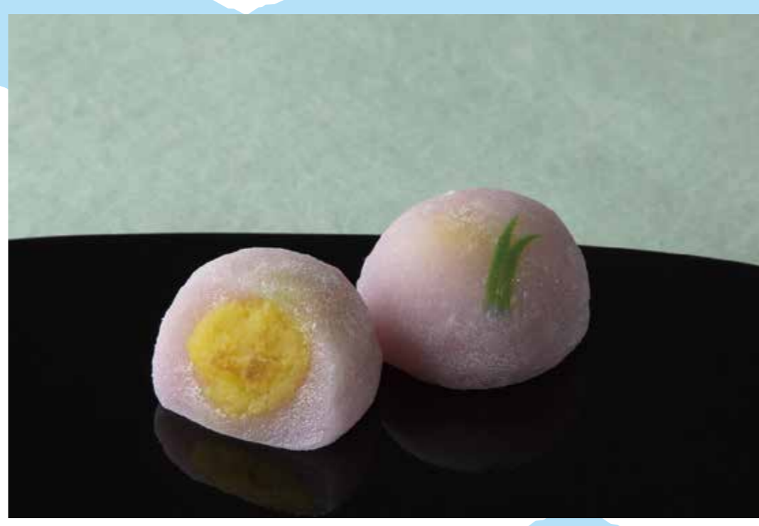
宗家 源 吉兆庵 [1F]