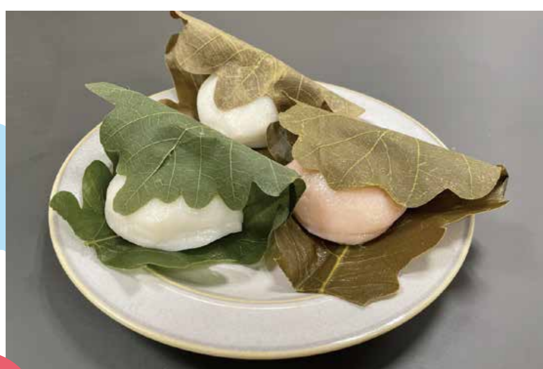
はちまるステーション [2F]