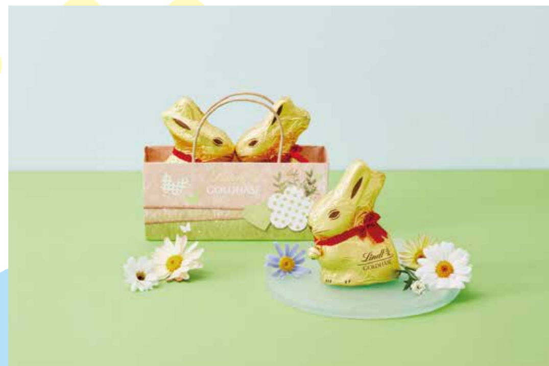
リンツ ショコラ プティック [1F]

高尾ポテトの定番のプレーン、ごま、あずきが1個ずつ入った、 3種類の味が楽しめるコンパクトなセットです。