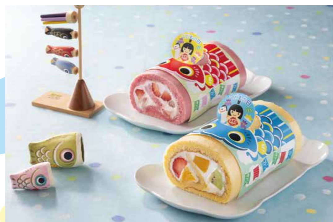
フロブレステージュ [1F]

〈上〉こどもの日 苺づくしのロールケーキ 1,879円 苺風味のふんわりスポンジで、苺と苺クリームを巻きました。 苺の美味しさが存分に楽しめます。