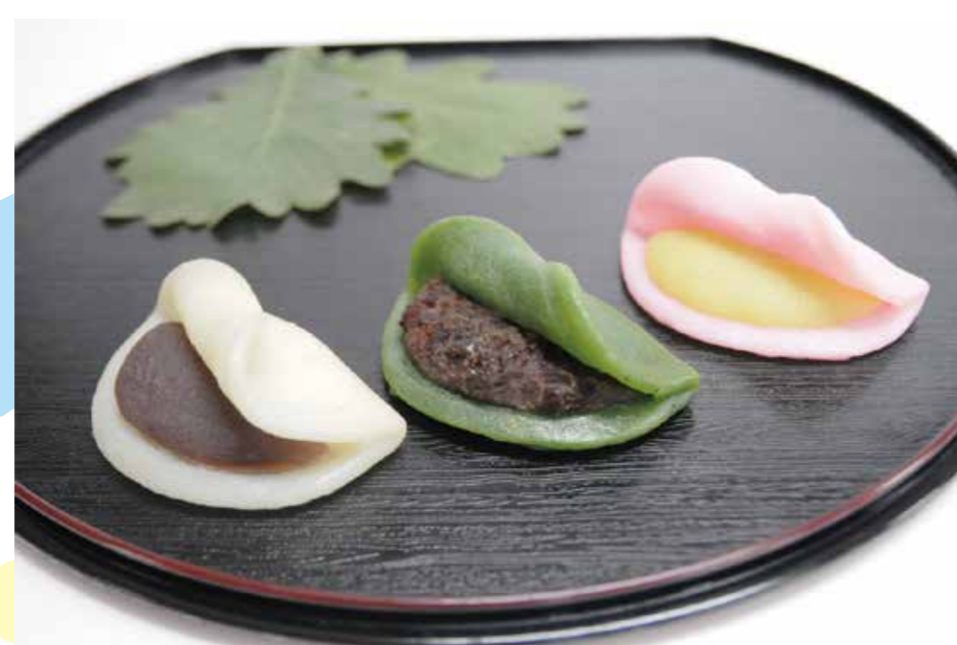
桔梗屋 黒蜜庵 [1F]

八王子市大横町にある創業90年以上の 老舗和菓子店がつくるこだわりの柏餅です。国産うるち米の上新粉と、 つぶあん・こしあんは国産大豆を使用しております。