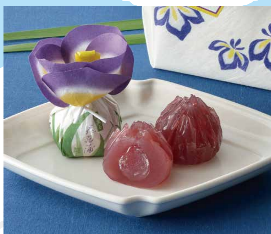
菓匠 清閑院 [1F]