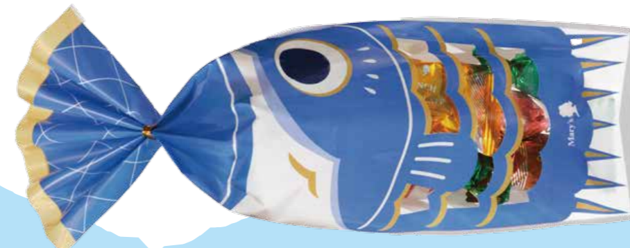
メリーチョコレート [1F]