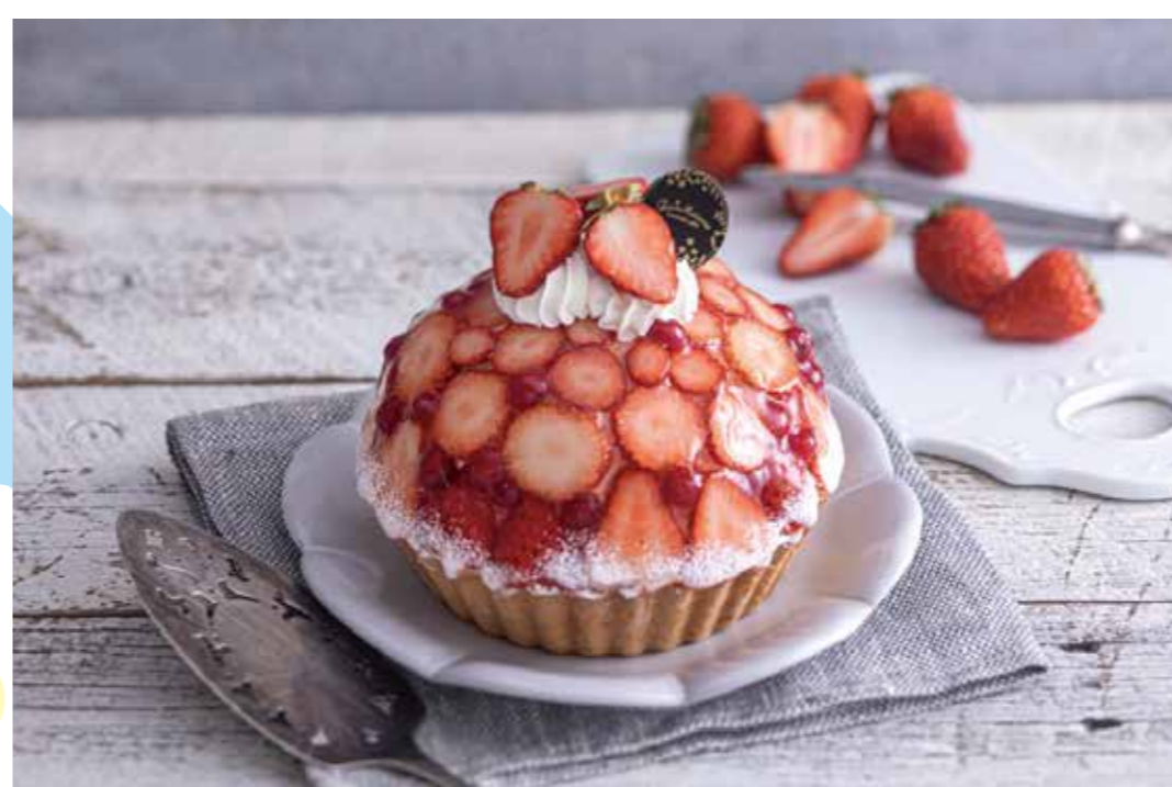
ラ・メゾン アンソレイユターブルパティスリー [1F]

口当たりの良いなめらかなスポンジで、 苺・オレンジ・キウイ・黄桃を巻き上げました。